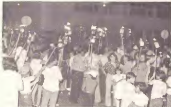
Un grupo grandi a forma dilanti di oficina di gobierno pa prepara pa e parada di flambeuw ariba 18 di Maart 1979.